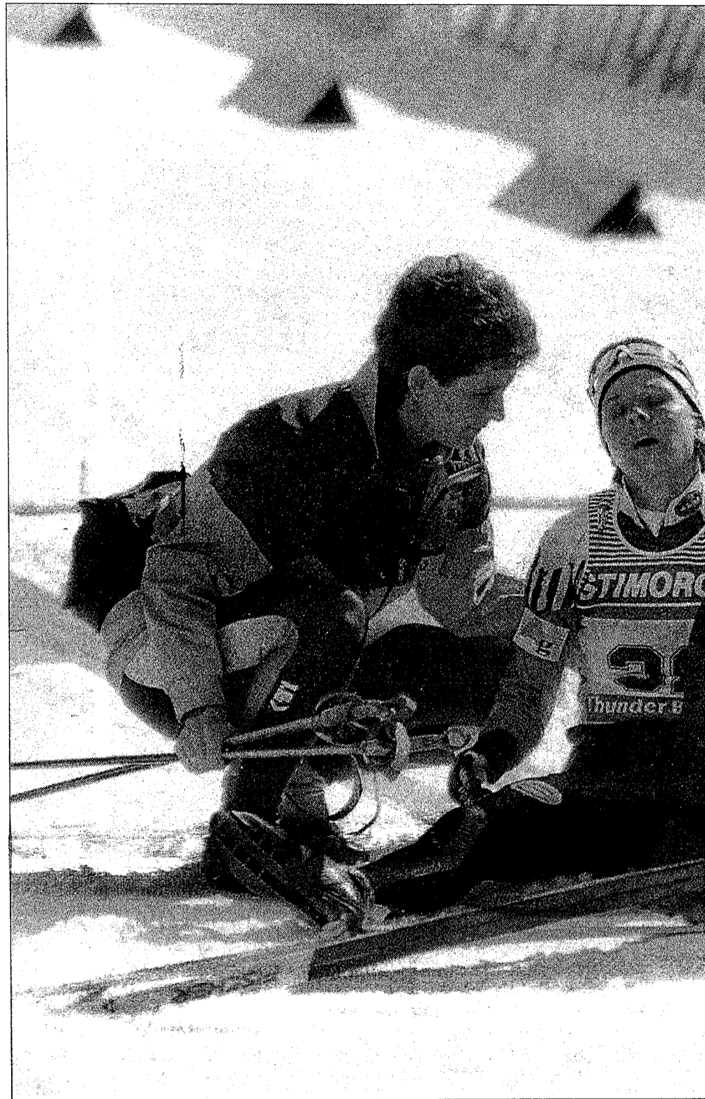
Thunder Bay maailmameistrivõistluste teenindajad aitavad jalule finišis kokkukukkur

Koondise naistele tundus Šmiguni alla sattumine profes-