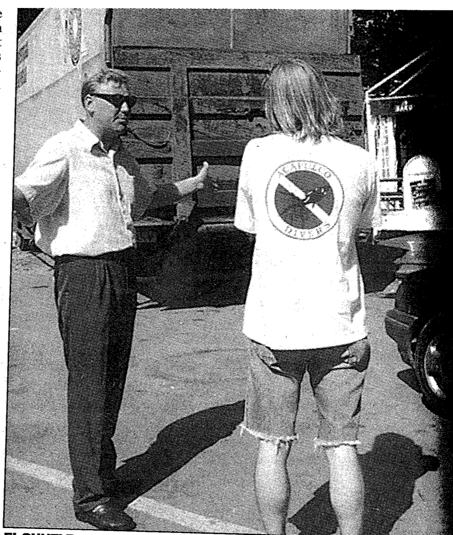
EI SUHTLE: Päikesepillidega mees, kes end Merekeskuse abidirektoriks nimetas, kadus ajakirjanikku ja fotograafi märgates rahva hulka.

"See on siis nüüd aus konkurents," ohkas tegevjuht.