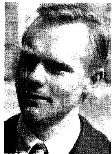
VAHENDAJA: André Küüsvek.

Hansapank sai aga enda kätte tõusutrendis aktsiaportfelli, kusjuures ta ei pidanud selle eest kohe reaalselt raha välja käima. Hansapank on nende aktsiatega