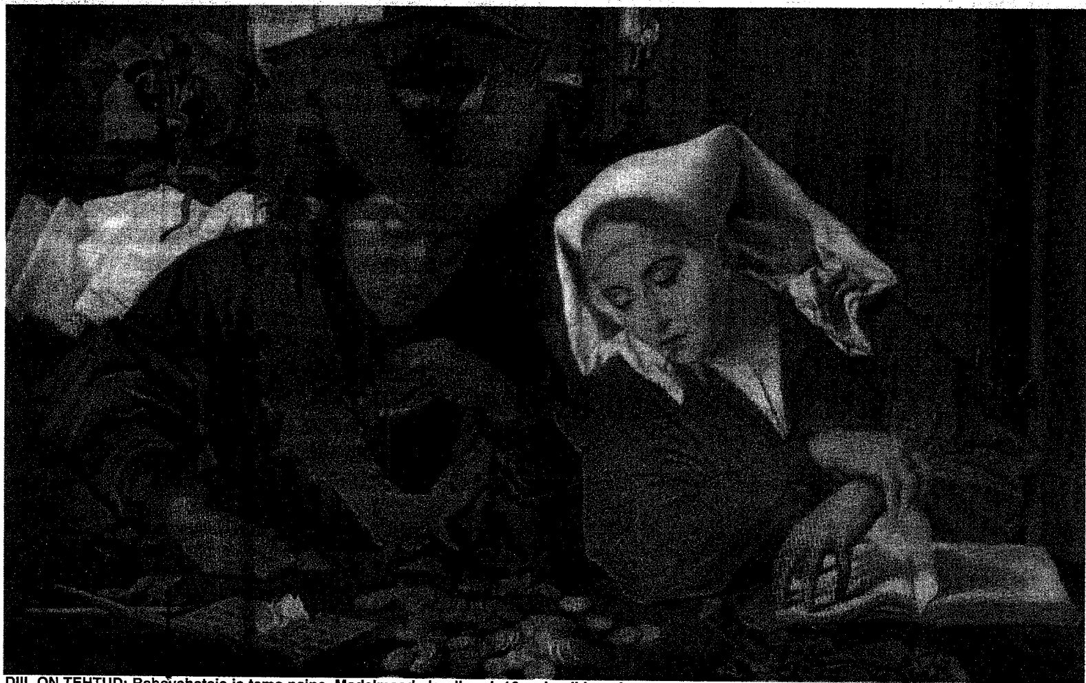
DIIL ON TEHTUD: Rahavahetaja ja tema naine, Madalmaade koolkond, 16. sajandi I pool.

ja kõrge efektiivsusega investeringust. Maapanga esimestest võtmemängijad on aga "oma panga" pidamiseks valmis isegi peale maksma. Pank avab pääsu info ja raha juurde. Mõlemad aitavad säilitada võimu. Neile sobis Sarapuu rohkem kui Jaaksoo.